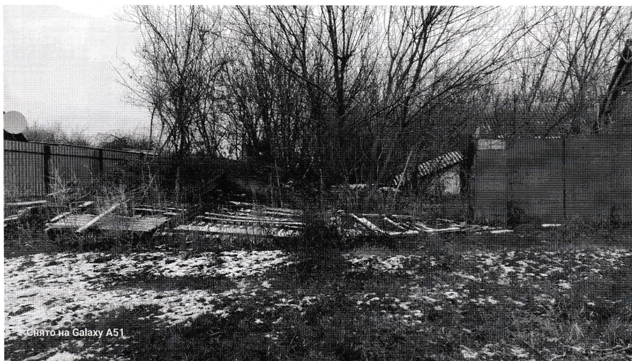
Фото таблица (Воронежская область, Воробьёвский район, село Берёзовка пер. Первомайский д.6)

к акту осмотра здания, сооружения или объекта незавершенного строительства при выявлении правообладателя ранее учтённых объектов недвижимости № 74 от 05.11.2024 г.