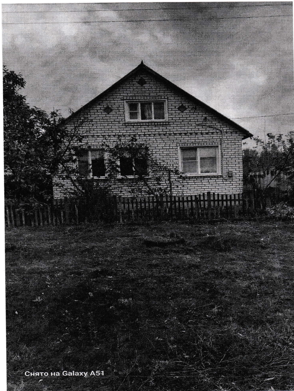
Фото таблица (Воронежская область, Воробьёвский район, село Елизаветовка ул. Октябрьская д.22 )

к акту осмотра здания, сооружения или объекта незавершенного строительства при выявлении правообладателя ранее учтённых объектов недвижимости № 51 от 17.09.2024 г.