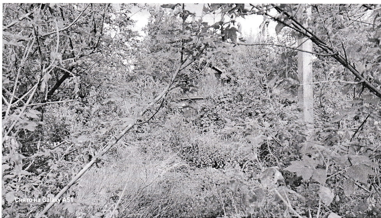
Фото таблица (Воронежская область, Воробьёвский район, село Верхнетолучеево ул. Свободы д.124)

к акту осмотра здания, сооружения или объекта незавершенного строительства при выявлении правообладателя ранее учтённых объектов недвижимости № 22 от 07.05.2024 г.